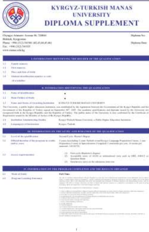
4.3. Program Details and the Individual grade/credits obtained